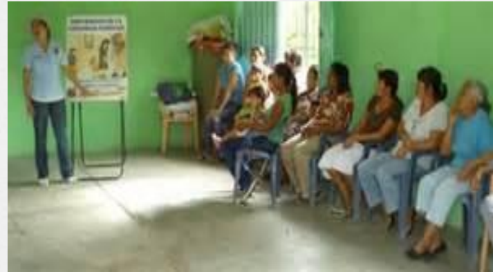
Pláticas con el psicólogo